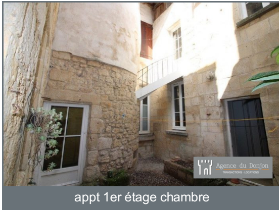
appt 1er étage chambre